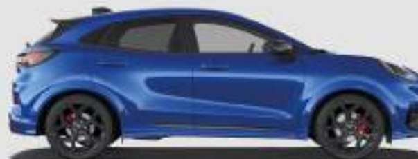
ST: 4226 mm

ST-Line, ST-Line X, BlueCruise Edition: 1548 mm