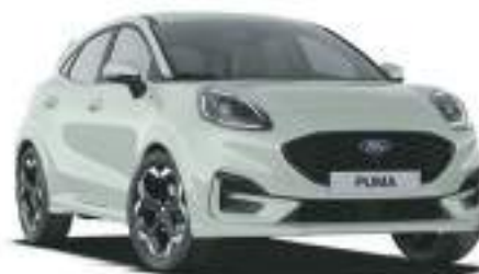
CACTUS GREY - lakier zwykły 2 500 zł Lakier niedostępny dla wersji BlueCruise