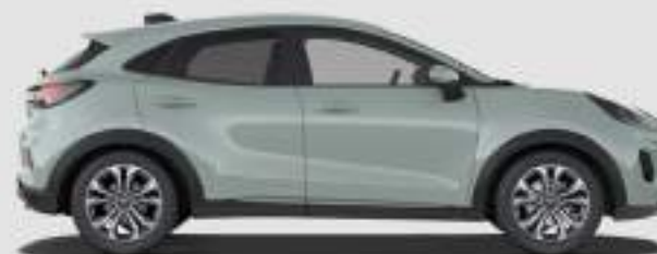
Titanium: 4186 mm