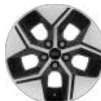
19" obręcze kół ze stopów lekkich, z wykończeniem w kolorze czarnym / metalicznym, ogumienie letnie 225/40