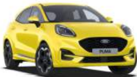
ELECTRIC YELLOW - lakier specjalny bez dopłaty Lakier niedostępny dla wersji BlueCruise