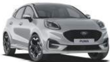
SOLAR SILVER - lakier metalizowany 2 500 zł bez dopłaty dla wersji BlueCruise