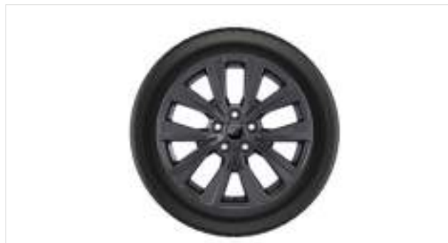
17" ALUMINIOWE KOŁA ZIMOWE (2 538 181) OPONA: SEMPERIT SPEED-GRIP 5, 215/55 R17 98 V XL 5 708 zł