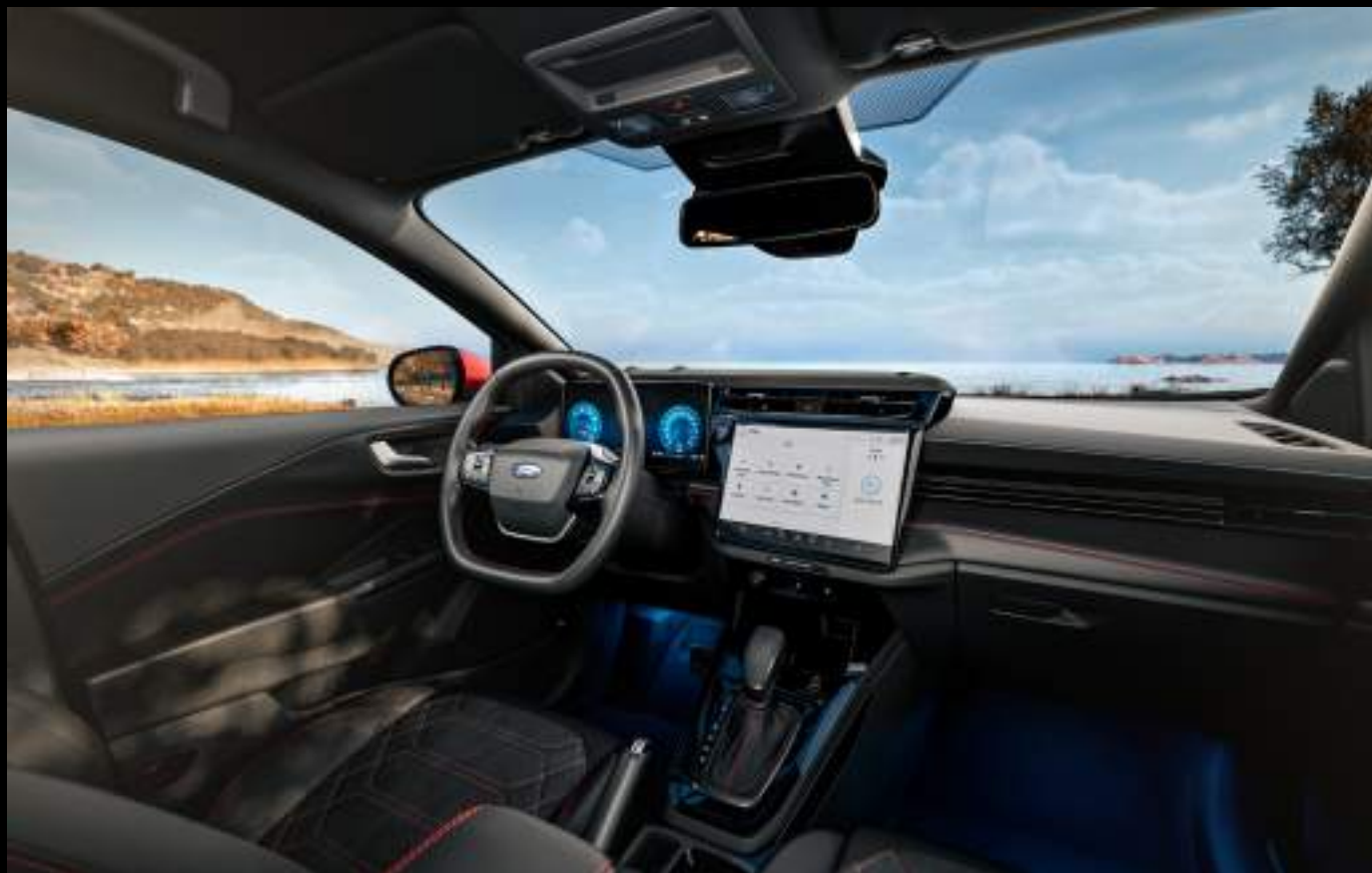
Ford Puma® w wersji ST-Line X z opcjonalnym wyposażeniem

We wnętrzu nowej Pумы znajdziesz najnowszą generację intuicyjnego systemu Ford SYNC 4 z nawigacją satelitarną - to najbardziej zaawansowany system multimedialny w historii Forda. Bezprzewodowa obsługa Apple Carplay™ i Android Auto™ umożliwia pełną integrację z Twoim smartfonem, dzięki czemu możesz korzystać z ulubionych aplikacji na ekranie samochodu - szybko, bezpiecznie i komfortowo.