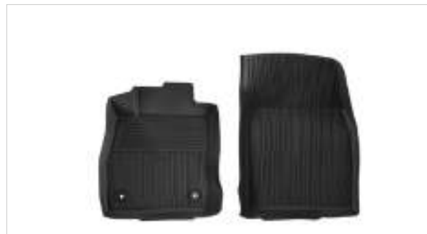
DYWANIKI PODŁOGOWE, GUMOWE CZARNE - NA PRZÓD (2 439 078) 284 zł