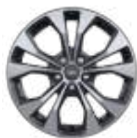
17" obręcze kół ze stopów lekkich, z elementami w kolorze czarnym, ogumienie 215/55