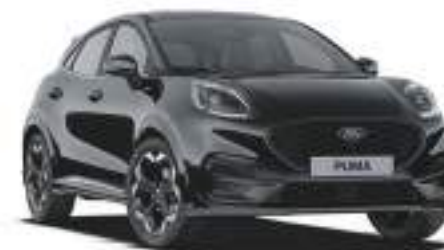
AGATE BLACK - lakier metalizowany 2 500 zł bez dopłaty dla wersji BlueCruise