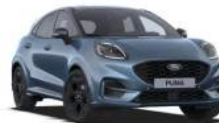
VAPOUR BLUE - lakier metalizowany specjalny bez dopłaty Lakier dostępny tylko dla wersji BlueCruise