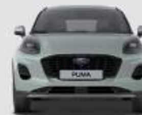
Titanium: 1930 mm