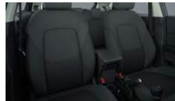
Ford Puma® w wersji Titanium w kolorze Electric Yellow (bez dopłaty) Wnętrze: Tapicerka materiałowa (wyposażenie standardowe)