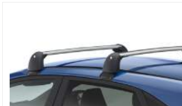
BAGAŻNIK DACHOWY (2 527 164) 1 513 zł