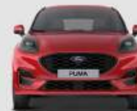
ST-Line, ST-Line X: 1930 mm

ST-Line, ST-Line X, BlueCruise Edition: 1548 mm