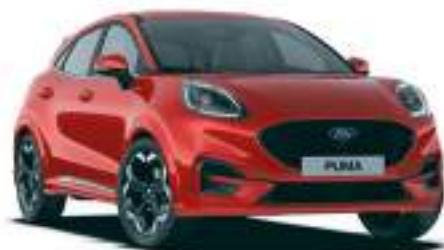
FANTASTIC RED - lakier metalizowany specjalny 3 800 zł Lakier niedostępny dla wersji BlueCruise