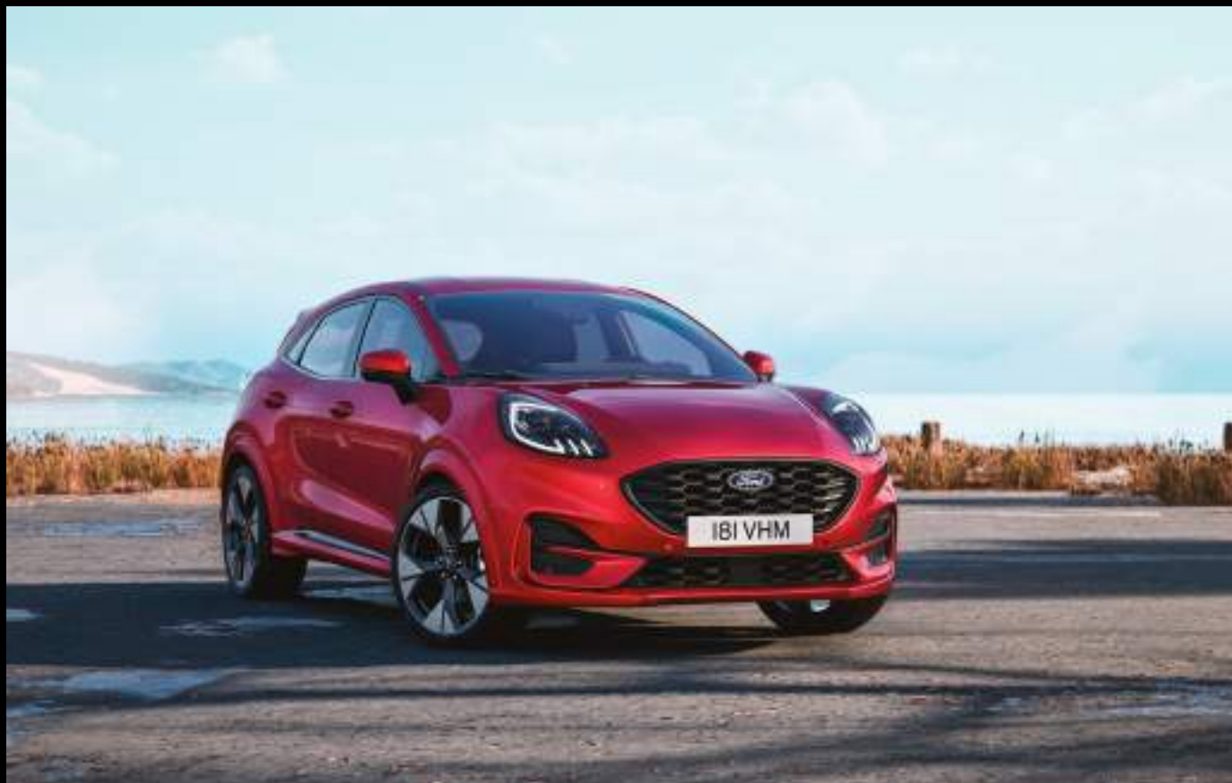
Ford Puma® w wersji ST-Line X z opcjonalnym wyposażeniem. Kolor nadwozia: Fantastic Red (wymaga dopłaty)

To samochód, który nie tylko nadąży za tempem miasta - on je wyprzedza. Puma® - to SUV stworzony dla tych, którzy chcą czuć wolność i pewność na każdej drodze.