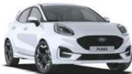
FROZEN WHITE - lakier zwykły 1 000 zł Lakier niedostępny dla wersji BlueCruise