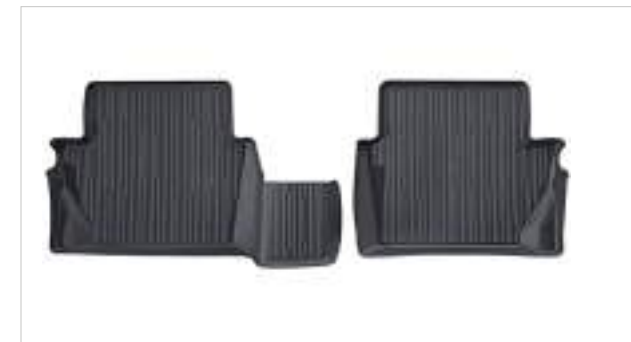
DYWANIKI PODŁOGOWE, GUMOWE CZARNE - NA TYŁ (2 109 989) 186 zł