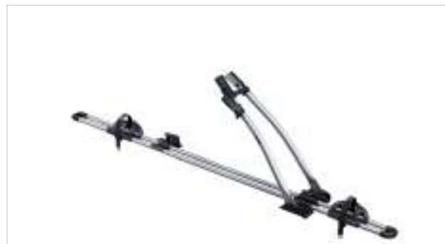
THULE®* UCHWYT DO PRZEWOZU ROWERU FREERIDE 532 (1 746 077) 482 zł - wymaga zamówienia bagażnika dachowego