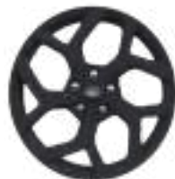
18" obręcze kół ze stopów lekkich, z wykończeniem w kolorze czarnym, ogumienie 215/50