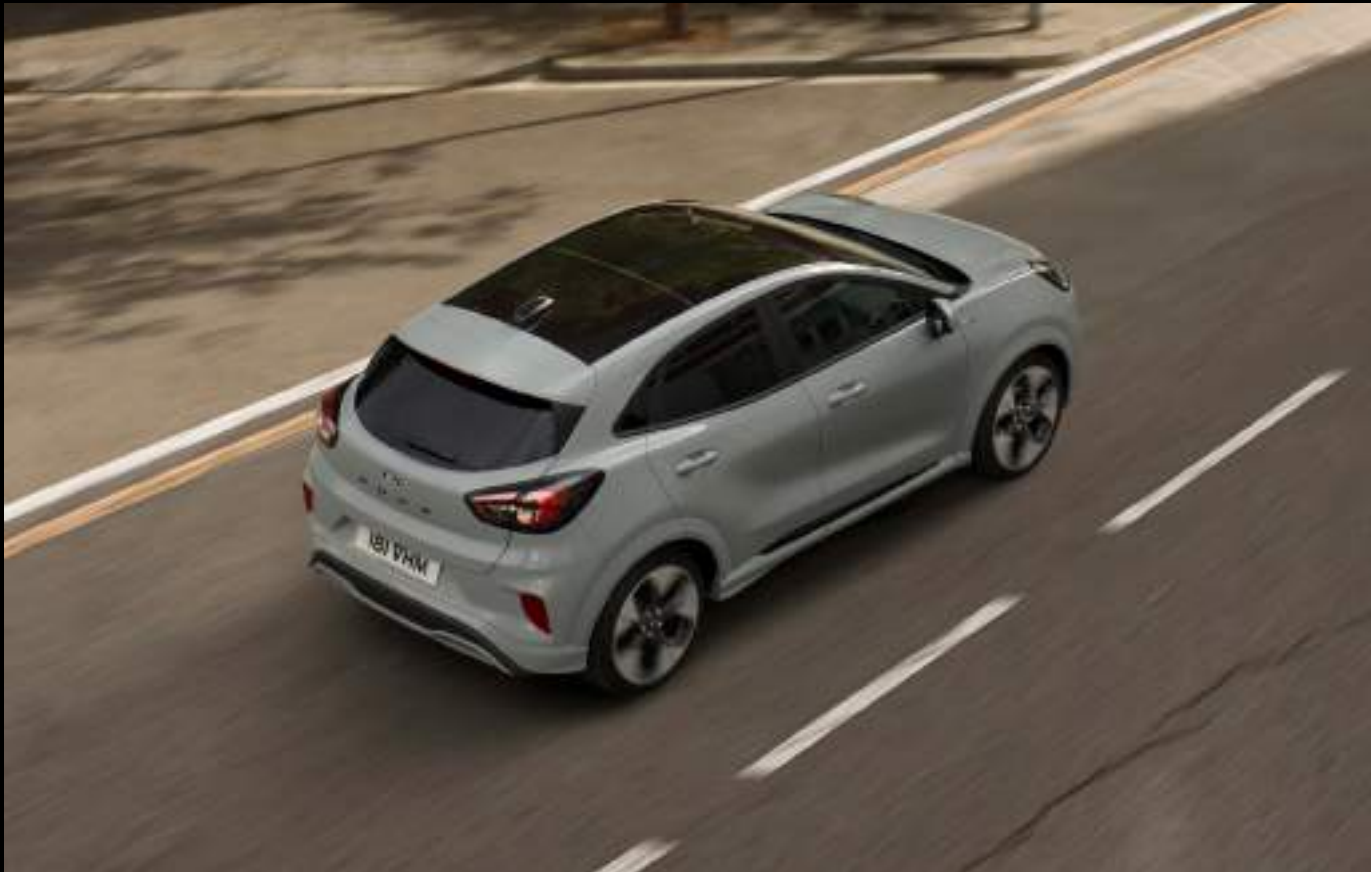
Ford Puma® w wersji ST-Line X z opcjonalnym wyposażeniem. Kolor nadwozia: Cactus Gray (wymaga dopłaty)

Ford Puma redefiniuje pojęcie przestrzoności w klasie kompaktowych SUV-ów, oferując wnętrze zaprojektowane z myślą o Twoim maksymalnym komforcie. Wyposażony m.in. Innowacyjny MegaBox – dodatkowy, 80-litrowy schowek pod podłogą bagażnika, który pozwala na przewożenie wysokich przedmiotów w pionie oraz łatwe czyszczenie dzięki korkowi odpływowemu. Dzięki elastycznej konfiguracji siedzeń i przemyślanym schowkom, auto z łatwością dotrzymuje kroku Twoim pasjom, od weekendowych wyjazdów po codzienne, miejskie wyzwania.