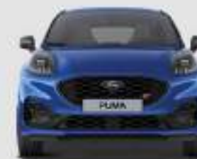
ST: 1930 mm