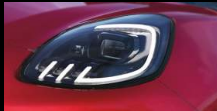
Reflektory Full LED - matrycowe