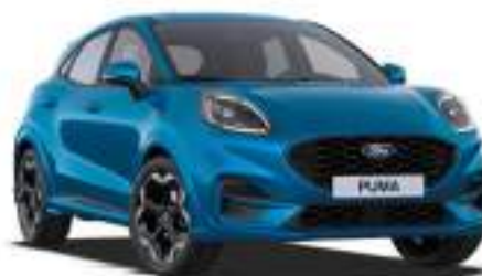
DIGITAL AQUA BLUE - lakier metalizowany specjalny 3 800 zł Lakier niedostępny dla wersji BlueCruise