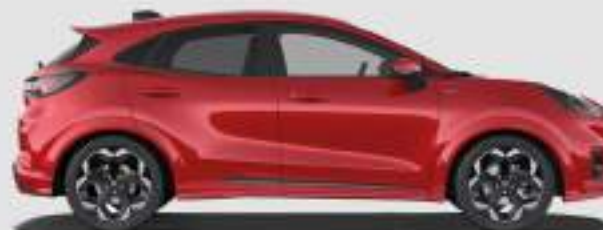
ST-Line, ST_Line X, BlueCruise Edition: 4225 mm