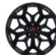
19" obręcze kół ze stopów lekkich, z logo ST, z wykończeniem w kolorze ciemnografitowym, ogumienie letnie 225/40