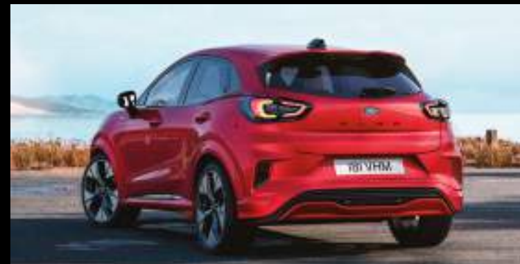
Tylne światła w technologii LED

Wyposażenie standardowe dla wszystkich wersji